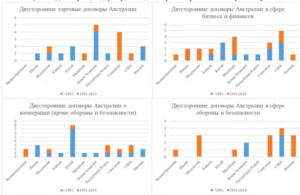
Рисунок 2. Действующие двусторонние договоры Австралии с некоторыми странами